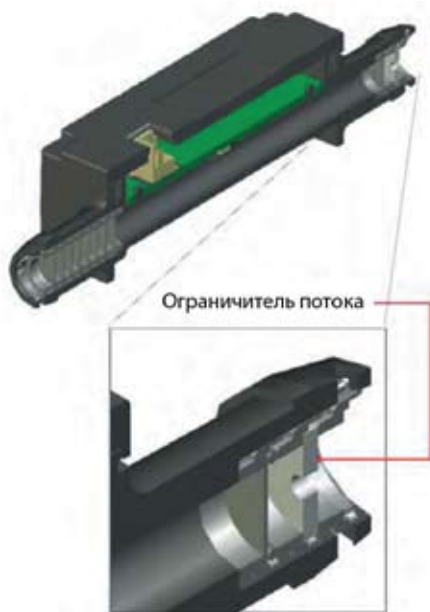
Рис. 2. Элемент, снижающий пульсирующий поток

позволяющее стабилизировать поток газа (рис. 2).